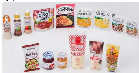
※5,000円相当の商品例

【継続保有期間半年以上】 100株以上：1,000円相当 500株以上：3,000円相当 【継続保有期間三年以上】 100株以上：1,500円相当 500株以上：5,000円相当の自社グループ商品とキューピーグッズ(ポーチ)