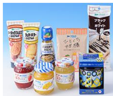
※3,000円相当の商品例