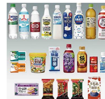
※3,000円相当の商品例